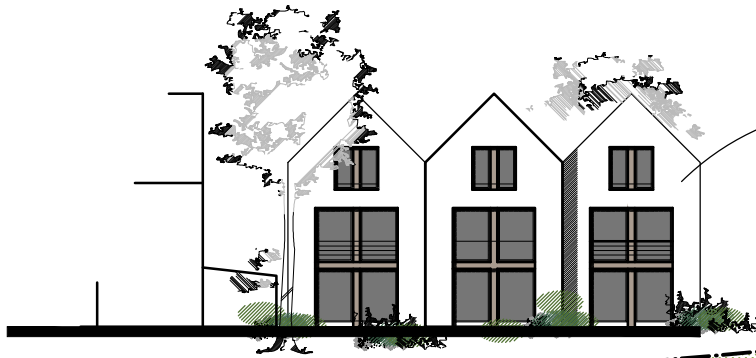
Neubau (Ansicht Süd-Osten) 3 Stadthäuser/Reihenhäuser, moderner Architekturstil in Anlehnung an den Bestand. Anpassung erfolgt durch Dachform Material und Farbigkeit ( Putz/Holz)

Bestands-Villa, Umbau/Erweiterung für Wohnnutzung mit 2-3 Wohneinheiten. Erschließung erfolgt über Kiefernrain