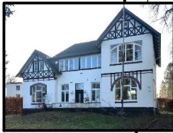
Villa Bestand Nr.386

Bestands-Villa, Umbau/Erweiterung für Wohnnutzung mit 2-3 Wohneinheiten. Erschließung erfolgt über Kiefernrain