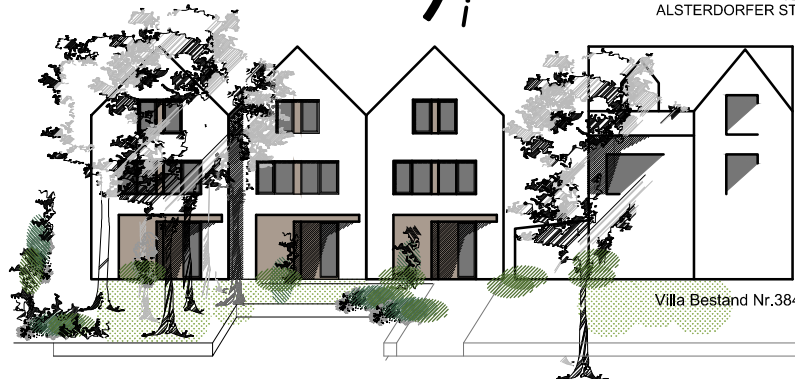
Villa Bestand Nr.384